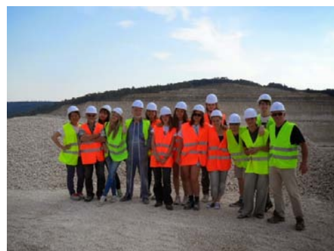
Les bénévoles à la carrière

Puis, profitant d'une belle fin d'après-midi, les bénévoles sont partis découvrir un autre château du canton valcolorois: le château de Montbras, construit à la fin du XVI e siècle. Enfin, pour retourner à Montigny-lès-Vaucouleurs, le groupe est passé voir le lavoir de Taillancourt.