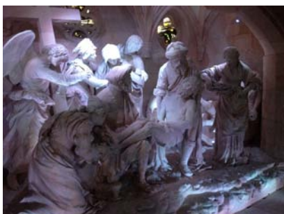
La Mise au Tombeau, Ligier Richier

Avant de retourner au gîte, le groupe est allé prendre un verre sur le quai de Londres à Verdun.