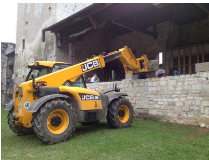
Livraison des pierres

À 18h, la mairie de Vaucouleurs a organisé un pot d'accueil pour remercier les bénévoles de leur présence. L'Est Républicain a suivi l'événement.