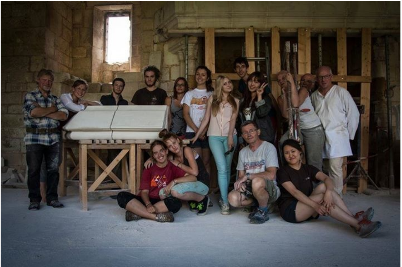
Les bénévoles devant les pierres taillées.