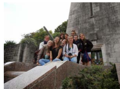
Les bénévoles à Verdun