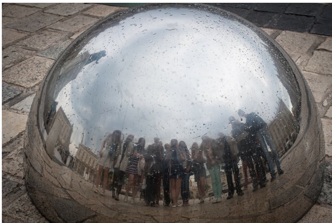
Les bénévoles devant l'œuvre de Paul Bismuth, Points de vue .

Pour dîner, le groupe s'est rendu dans une pizzeria à proximité de la place Stanislas et a ensuite profité d'un spectacle monumental « Rendez-vous Place Stanislas » sur cette même place. Il retrace l'histoire de la ville à travers 11 scènes, mettant surtout en avant la Première Guerre Mondiale.