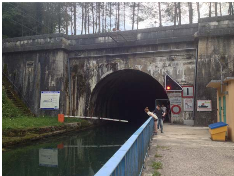
Tunnel de la Marne au Rhin

Après la journée de travail, les bénévoles sont allés visiter le village de Mauvages, à quelques kilomètres de Vaucouleurs afin de découvrir notamment, une fontaine-lavoir de style néo-égyptien - la fontaine du Déo - et le tunnel sur le canal de la Marne au Rhin.