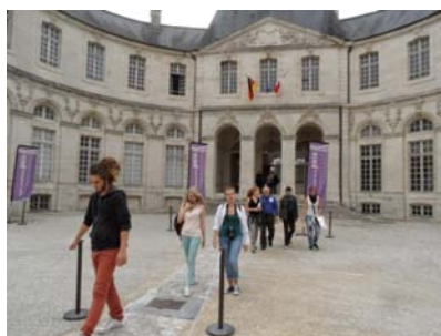
Le Centre Mondial de la Paix