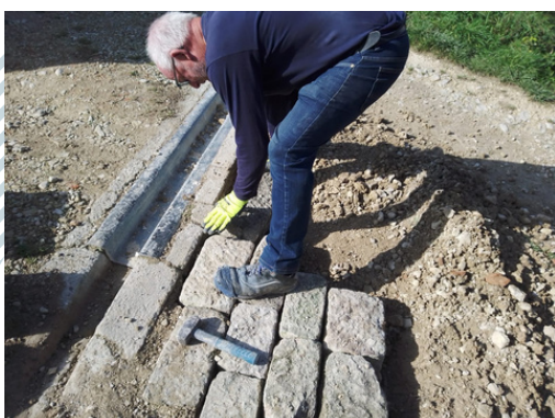
La restauration du chemin d'accès