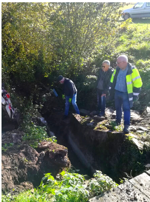
Le sauvetage des douves