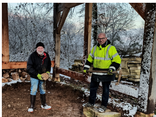
Le dallage de la forge