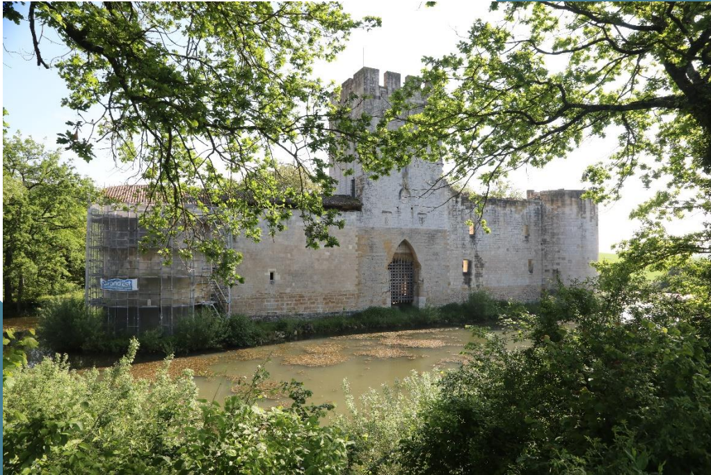
Congres Rempart Mai 2024 GOMBERVAUX