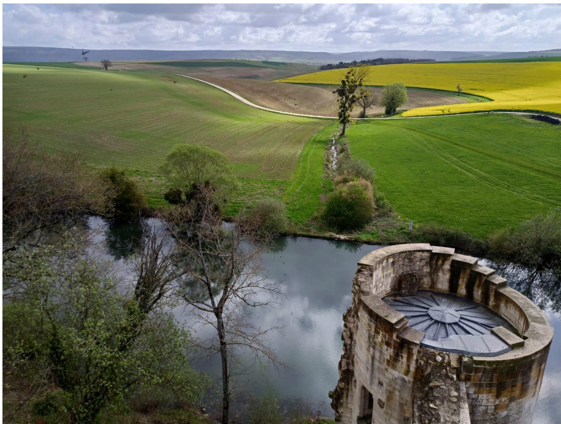
Gombervaux - 10 avril 2024